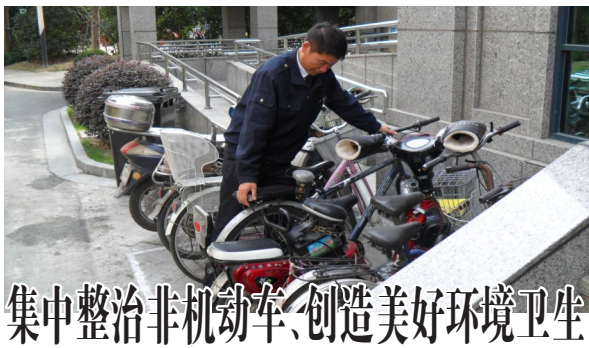
集中整治非机动车、创造美好环境卫生