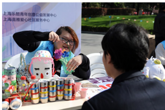
上海乐龄青年创意公益发展中心 上海喜雅爱心社区服务中心

3月底,由华阳街道主办、上海喜雅爱心社区服务中心协办的华阳社区社会组织公益伙伴日在中山