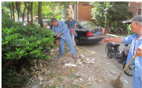
上图为居委干部与物业保洁正在清理绿化带内的垃圾