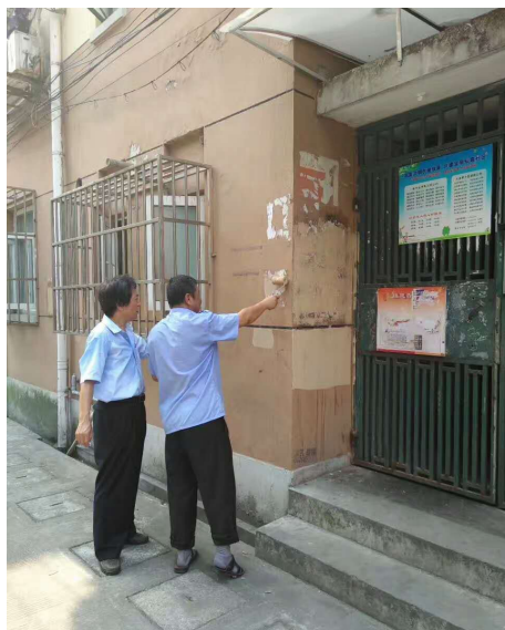
左图:清扫工在清理卫生死角。右图:物业人员在进行铲除小广告后的粉刷。