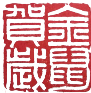
篆刻《金鼠贺岁》▲ 春联 ▶ 赵志坚