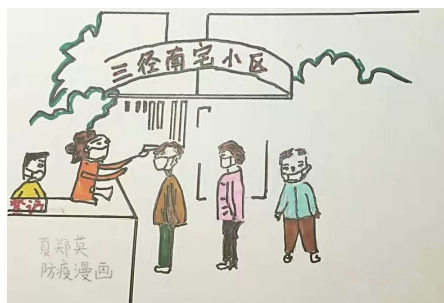
《防疫关系你我他》 夏郑英 防疫漫画