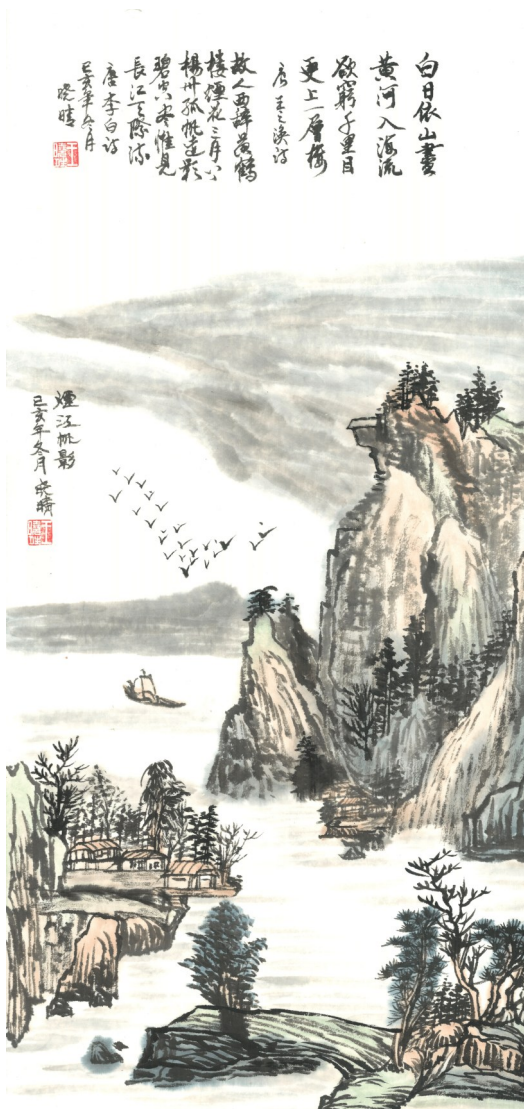
山水画《烟江帆影》 王晓晴

消失的垃圾桶成就了一个干净的工作环境，让员工回归工作，用更多的时间创造价值。（慧生活）